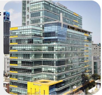
서울창업허브 성수 도시문제해결 & ESG 거점 센터