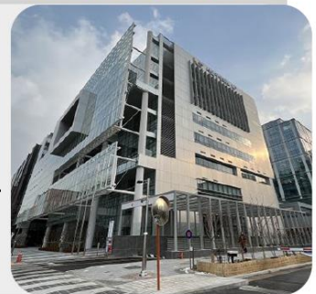
서울창업허브 M+ R&D 융복합 단지 기반 기업 벤처링 특화 센터