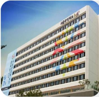
서울창업허브 공덕 창업생태계를 리드하는 혁신 거점 센터