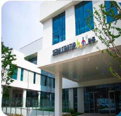
서울창업허브 창동 뉴미디어 커머스 & 테크 거점 센터